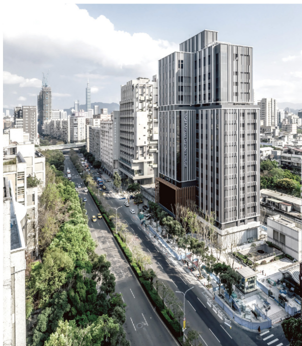
宏普 X 三井 和苑三井花園飯店

宏普建設股份有限公司不忘企業責任回饋社會，成立宏普社會福利慈善事業基金會，針對台灣弱勢族群的教育、急難與災害救助、學術研究等多項領域提供協助，自 106 年成立以來，向學校及眾多公益團體，播下善心種子，拋磚引玉讓幸福與愛永不止息，段董事長也獲聘為國立屏東科技大學校務發展委員會諮詢委員，為下一代教育善盡社會責任。